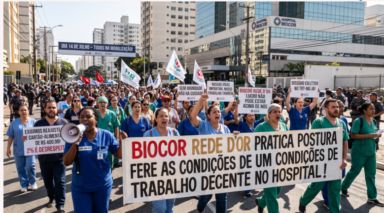
Imagem de IA

Tiveram o disparate de oferecer um reajuste salarial de apenas 2%, sob a alegação de que temos uma inflação acumulada extremamente baixa. Isso não reflete a realidade de profissionais que trabalham no limite de suas forças para atender